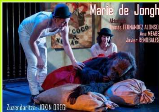
Zuzendaritza: JOKIN OREGI

Xebasek eta Cocó bikote artistikoa osatzen dute, biak dira pailazo. Ilusioa gainezka duten arren oraindik ez dute arrakasta nabarmenik lortu. Ikuski-zun berria prestatzen ari direla, Xebasek egiazko gorila bat erostea erabaki du, hezur aragizkoa. Sinistuta dago gorila mendea hartu eta numeroak erakutsiz gero, sekulako txalo zaparrada jasoko dutela. Halere gorila ez da izango egunen joanean gehien ikasiko duena: bai Xebasek eta baita Cocó ere inoiz ahaztuko ez duten ikasgaia jasoko dute.