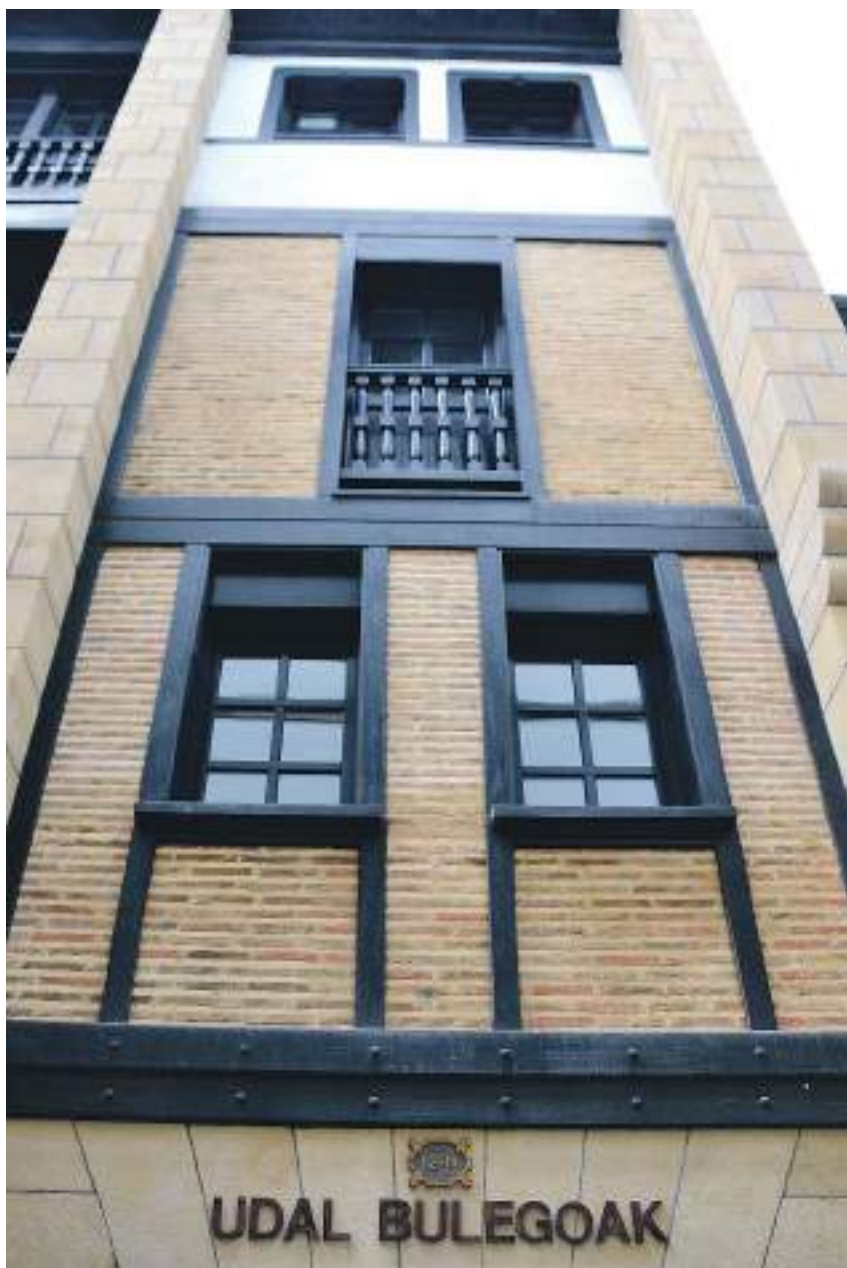
Panpinot kalean du egoitza Gizarte Zerbitzuen sailak. Haiek dinamizatu eta egikarituko dute plana. R.R.

Gabeziak kontutan izanda, Emeki emakumeen elkarteak ere kezka agertu zuen osoko bilkuraren aurreko egunean argitaratutako oharrean. Izan ere, teknikari eta departamentu zehatzik gabe berdintasun politika «eraginkorrak» garatu ahal izateko Hondarribiko Udalak bere esku dituen «neurri, baliabide eta langile eskasia» nabarmendu zituen taldeak. Harago egin zuten emakumeen elkarteak bere argudioak planteatzerakoan, eta esandakoaren arabera, Berdintasun departamentua eta teknikariaren figura sortzea 2020-2023 urteetarako helburu «operatibo» gisa ez planteatzeak haien kezka areagotzen du.