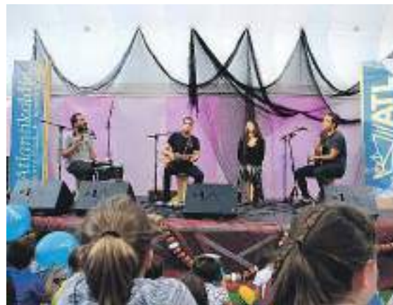
Iazko Atlantikaldiaren emanaldietako bat, Herrixkan . REBEKA PARRAS

Gainera, jaialdiaren antolaketan zeharkakotasunaren kulturaren oinarritutako dute, eragile eta erakundeen arteko konexioak bilatuz.