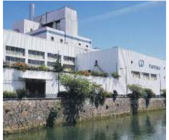
Papresa lantegian neurriak hartuta ari dira lanean. HITZA

tzitsu eman du Getek: «Langa-bezia izan gabe ere eskubidea izango dute ERTEa ezartzen duten enpresetan ari diren langileek hori eskatzeko, eta epez kanpo eskaera eginda ere berdin berdin balioko du; soilik telefonoz eta SEPE elektrokonoa erabilia egin ahaliko dituzte langileek eskaerak».