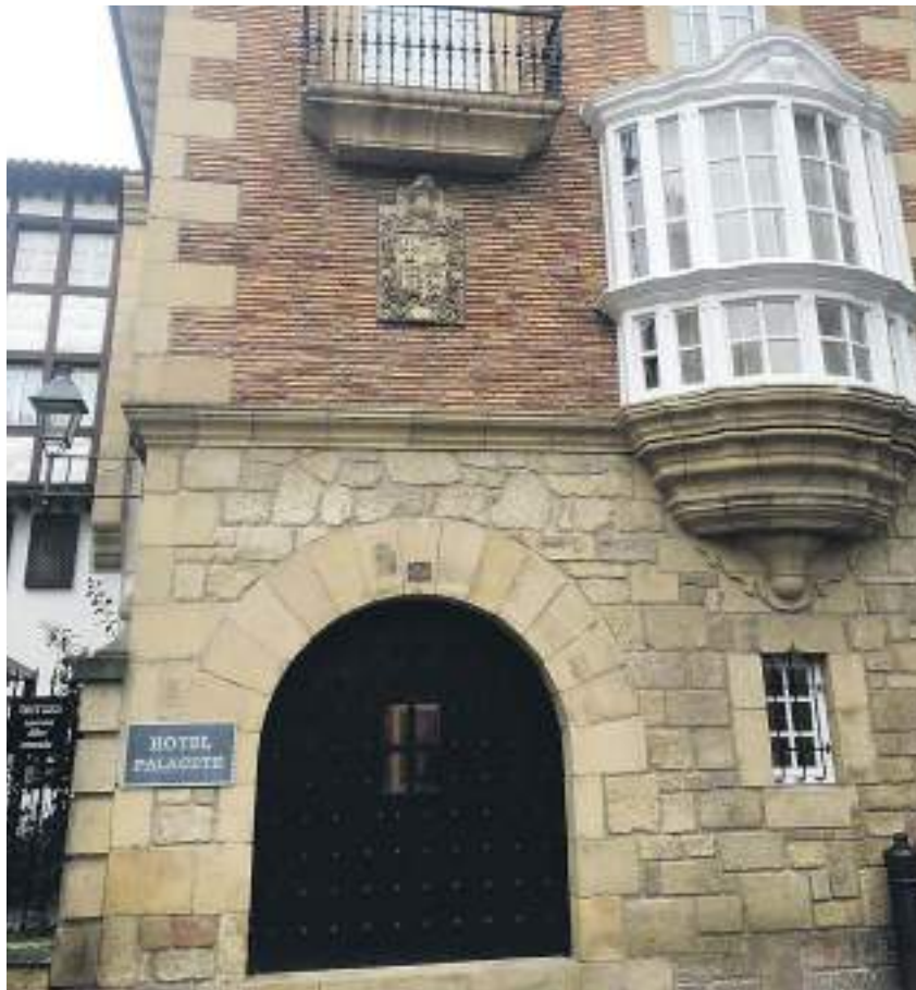
Hondarribiko Gipuzkoa plazan kokatuta dago Palacete hotela.