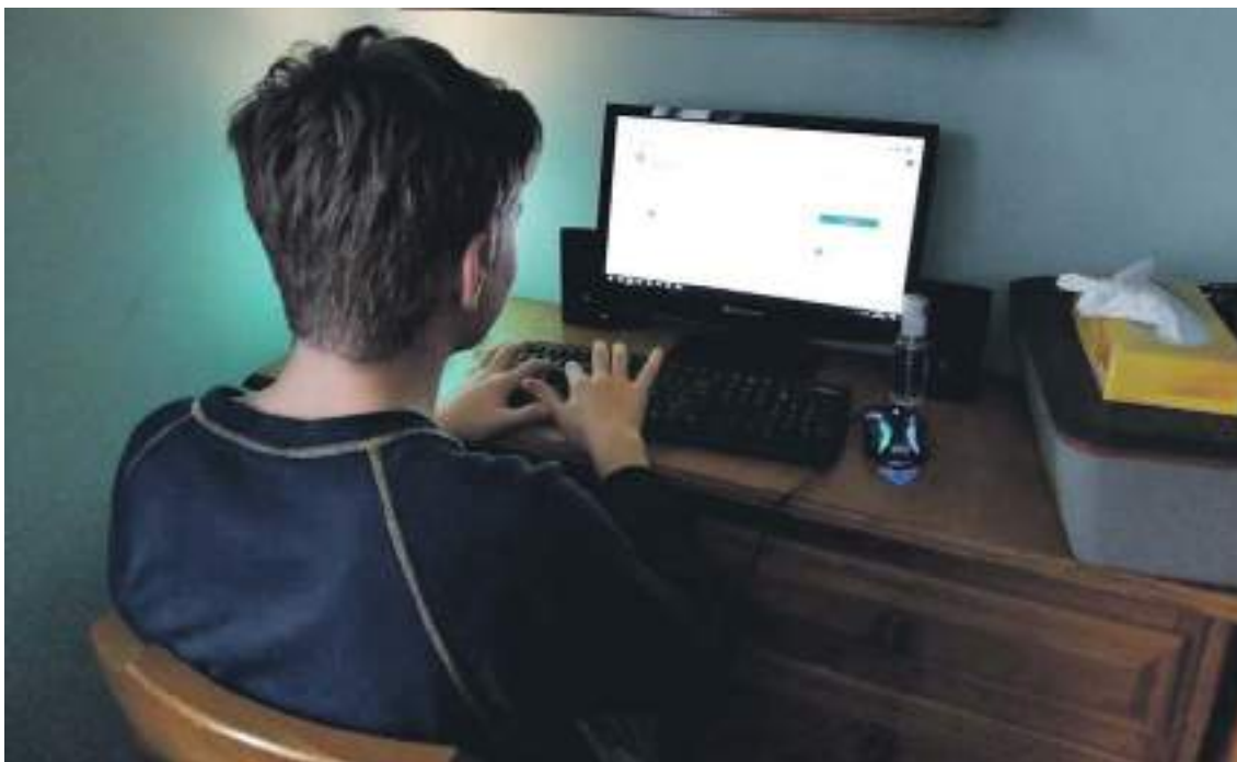
DBHko ikasle bat, etxetik lanean. Milaka dira Oarsoaldean eta Bidasoan etxetik ikasten ari diren haur eta nerabeak. HITZA

Honakoa ere ez da erronka makala, egoera larriak molde berriak erabiltzera derrigortu du irakaskuntza. Aste honetan hasi dira eskola ez presentzial horiek.