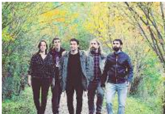
Lanbroak lehen diskoa aurkeztuko behar zuen hil honetan. HITZA

Lanbroa Bidasoko musika taldeak Ixilik ( Koronabirus version ) bere lehen singlea kaleratu du aste honetan sare sozialen bitartez. Emaitza txukuna lortu dute musikariek, kontutan izanda egoera. Izan ere, norberak eskura zuen instrumentuarekin, etxean sakelako telefonoarekin grabatutako lana da argitara emandakoa. Hilabete honetan aurkeztu behar zuen taldeak bere lehen diskoa, baina koronabirusak eragindako larrialdi egoera medio dena atzeratu behar izan dutela adierazi dute. Esaterako, Hondarribiko Kultur Etxean hilaren 27rako aurreikusitako kontzertua ere bertan behera uztera behartua ikusi dute bere burua taldekideek.