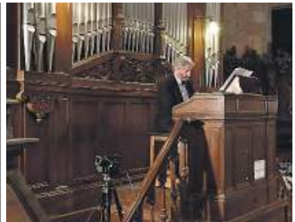
1842an eraiki zuten Done Eztebe parrokiako organoa. HITZA