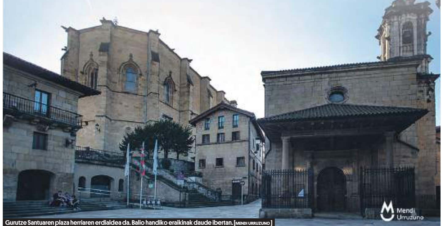
Gurutze Santuaren plaza herriaren erdialdea da. Balio handiko eraikinak daude ibertan.

Donostiatik 10 kilometrora kokatuta, Lezo 6.000 biztanleko herri bitxi eta erakargarria da. Iparraldean Jaizkibel mendiarekin egiten du muga, mendebaldean Pasaiako portuarekin, ekialdean Gaintzurizketako gainarekin, eta hegoaldean Errenteriarekin eta Oiartzun errekarrekin.