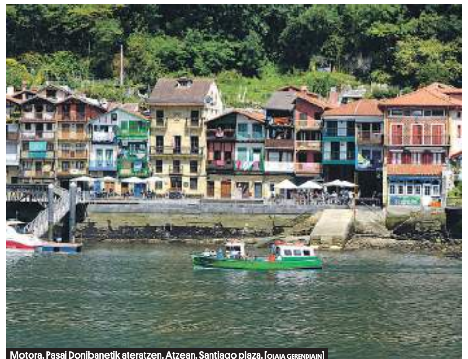
Motora, Pasai Donibanetik ateratzen. Atzean, Santiago plaza. [OLAIA GERENDIAIN]