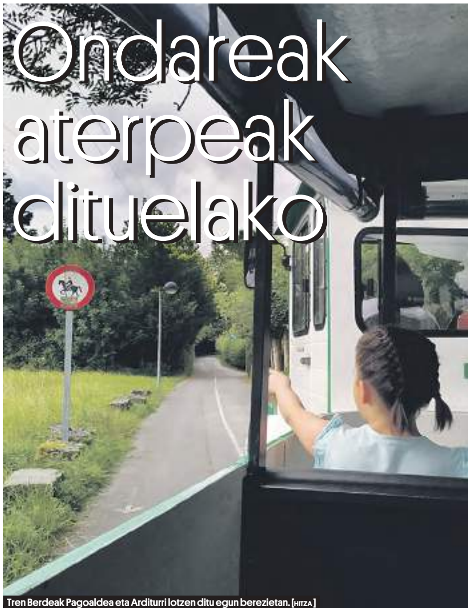
Tren Berdeak Pagoaldea eta Arditurri lotzen ditu egun berezietan. [HITZA]

Oiartzunek altxor asko ditu bai ezkutuan baita agerian ere; norberak ezagutu ditzake bere senak gidatuta. Hala ere, turismoarekin lotzen dituen kontzeptu bat badute, horiek museoak dira.