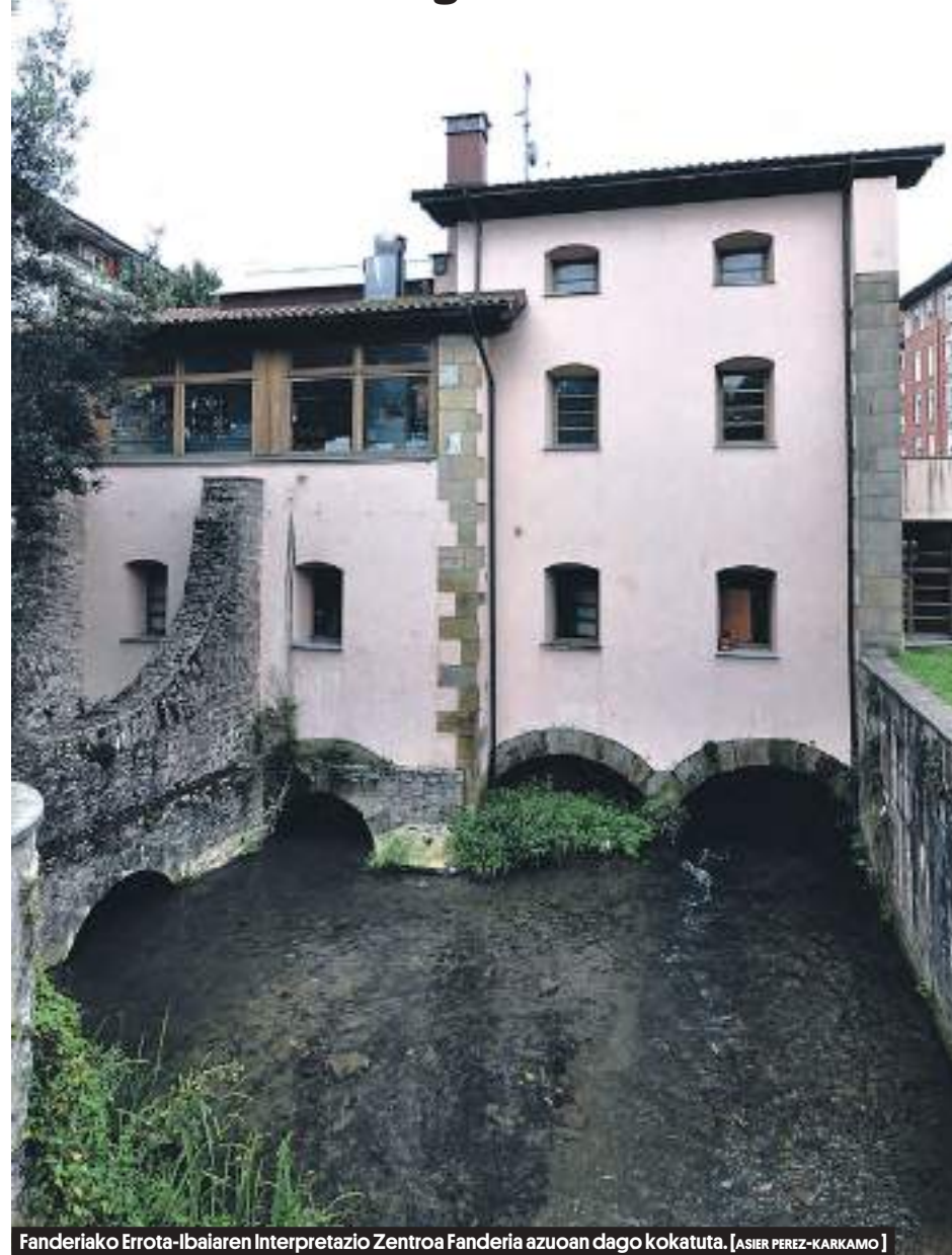
Fanderiako Errota-Ibaiaren Interpretazio Zentroa Fanderia azuoan dago kokatuta. [ASIER PEREZ-KARKAMO]

Erreterria-Oreterako iragana ulertzeko hainbat modu eskaintzen ditu herriak. Denen artean ondarez betetako zirkuitua osatzen dute, familian goza daitezke, era erraz eta erakargarrian.