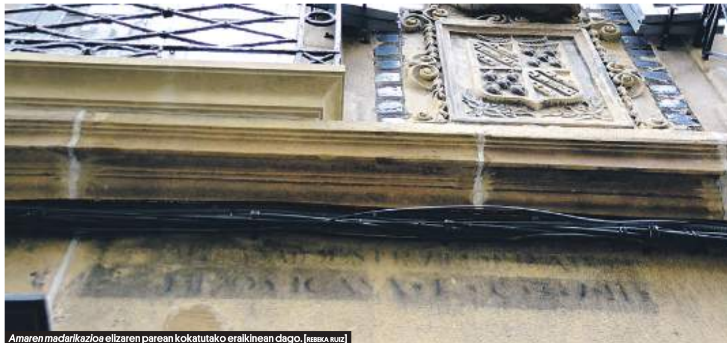
Amaren madarikazioa elizaren parean kokatutako eraikinean dago.

Parrokiaren eskuineko albotik aurrera egingo dute bisitariak Cristobal Rojas y Sandoval apezpikuari eskainitako plazarantz, gargolaz inguratutako Etxebeste edo Palencia Etxea ikustera. Handik gora egingo dute eskuin aldearantz, Bretxa eta Nafarroako Erresumako gazteluaren azken dorreaz eta