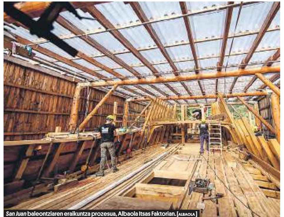
San Juan baleontziaren eraikuntza prozesua, Albaola Itsas Faktorian.

Ezin ditugu ahaztu, jakina, Antxo eta Trintxerpek eskaintzen dizkiguten aukerak ere, haien artean, txikienekin jolasean aritzeko gune zabalak eta lurraldeko gastronomiaz gozatzeko taberna herriko berdingabeak.