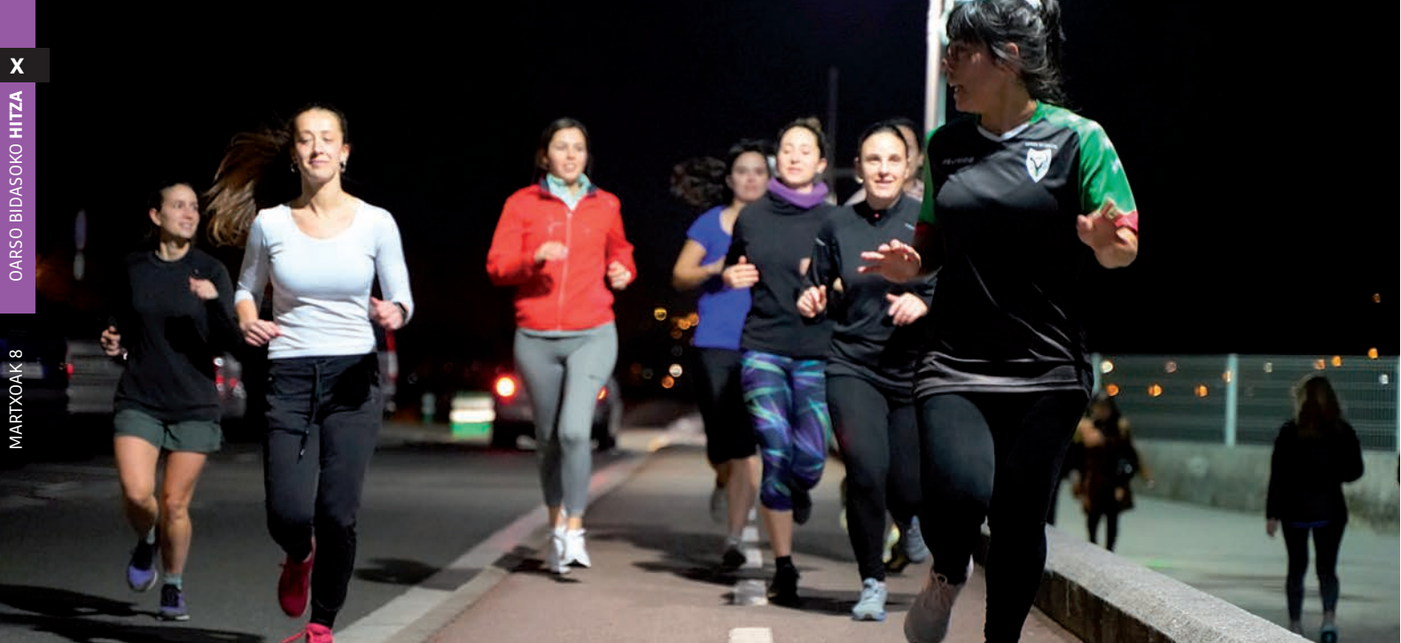
Hamabi emakumeko taldea osatu dute Hondarrribian, astelehen eta asteazkenero biltzen dira. Imanol Saiz