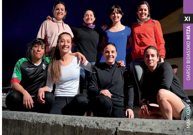
Hastapeneko talde bat ere osatu dute hondarribiarrek, «denek txoko bat izan dezaten». I. S.

tenak. Denetik egon behar da, bakoitzaren behar eta egoeraren arabera entrenamenduak egiten ditugu. Zure burua gainditzea bada nahikoa erronka, autoestimua pixka bat lortzeko balio du ere bai», azaldu du. Zentzu horretan Altxuk aitortu du gai izan dela «uste ez zuen hori egiteko» taldean hasi zenetik. «Erronkak jartzea ez da txarra, betiere gozamenaren bilatzen baduzu, lehiarik gabe», erantsi du.