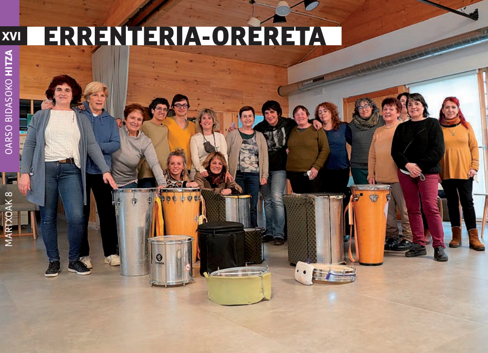
Erreneriako Batukada Feminista osatzen duten emakumeak. Imanol Saiz