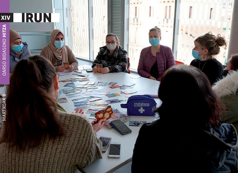
Palmera Monteron egiten dituzte saioak astean behin goizez edo arratsaldez. Imanol Saiz