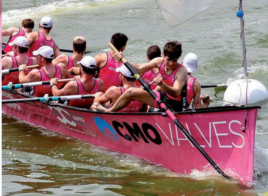
KAE1eko 'Erreka' ontzia, ekainaren 18an badian egin zen estropadan.