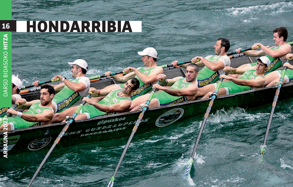
Hondarribia Arraun Elkarteko gizonen lehen taldea lehian. Josu Z.