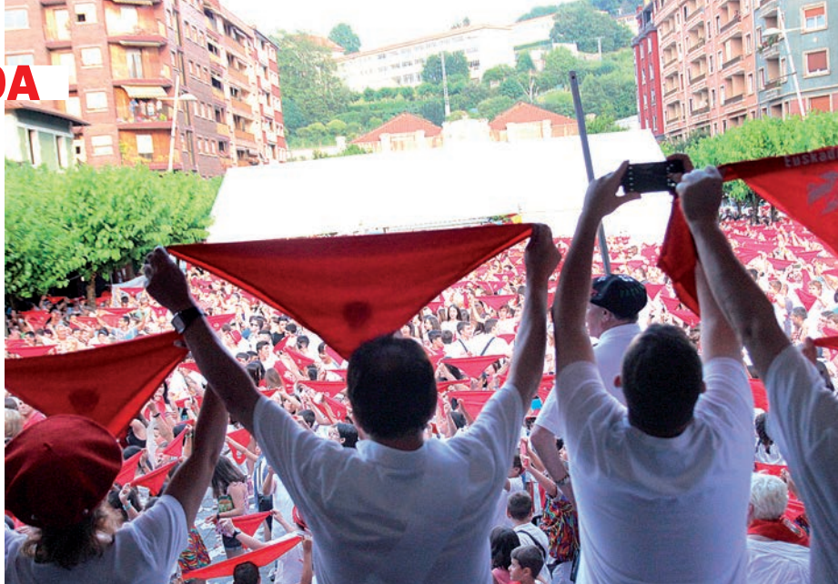
Asteazkeneko 20:00etan izango da txupinazoa, aurtien Biteri plazan. Olaia Gerendiain