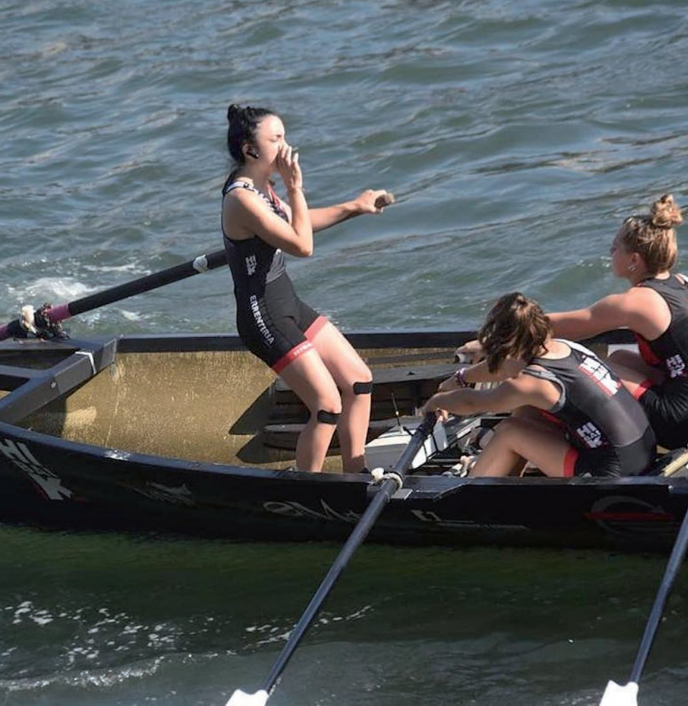
Hibaikako Zuriñe Alberdik eskuin belarran eramaten du 'pinganilloa'. HITZA

ematera eta informazio hori, nolabait, lagungarria da. Zenbaitetan entrenatzailearen lasaitasunerako ere izaten da». Erreka -ren lemazainak badu esperientzia entzungailurik gabe lehiatzen; izan ere, behin baino gehiagotan itzali edo deia moztu zaiola azaldu du. «Horrelakoetan antzerki pixka bat egin izan dut, ezer pasa ez balitz bezala. Tentsio