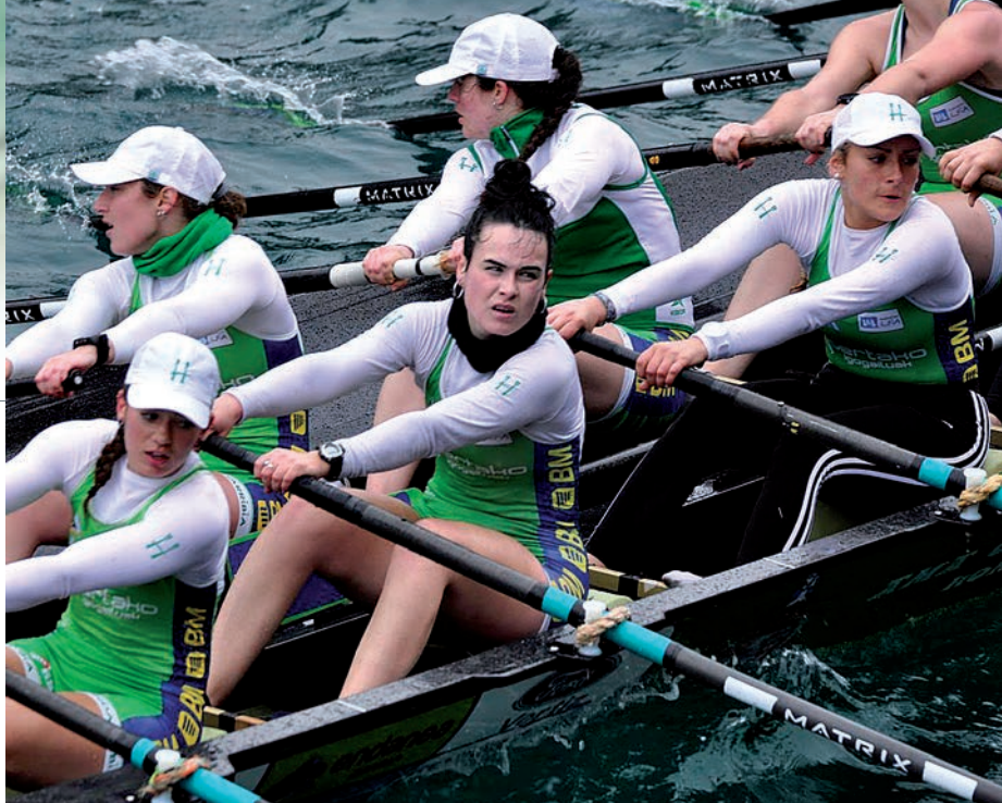
Hondarribia Arraun Elkarteko emakumeen eskifaia iren irudi bat. Josu Z.

Ama Guadalupekoa-ren prestatzaileak ez du ezkutatu «aurrean ibiliko diren traineruekin lehiatzeko moduan» izango direla. Iaz «irabazlea adina» ibili zirela aitortu du Orbañanosek, eta aurtengo helburua «lehengo urteko maila ematea» dela nabarmendu du: «Iazko maila lortzen badugu, handia izango da. Lehen postuetan ibiliko diren traineruekin lehian egon nahi dugu. Maila hori lortzen badugu, bizirik egongo gara, eta uda polita egiteko aukera izango dugula iruditzen zait». Neguko estropadak eta taldeen osiera ikusita, Bizkaiko eta Euskadiko txapelkun izan den Urdaibai jarri du faboritotzat.