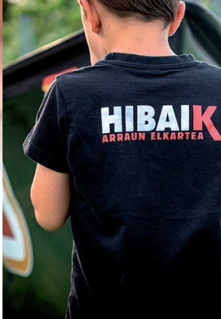
Haur bat Hibaikaren kamiseta soinean, denboraldiaren aurkezpenean.