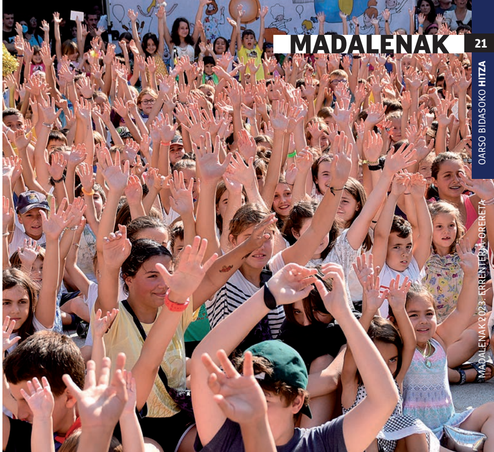
MADALENAK 2023 - ERRETERIA-ORERETA

Errenteriako Udalak ere festen jarraipen berezia egingo du herribizia.eus weborritik. Gaurko txupinazoa bertatik jarraitu ahal izango da, zuzeneko emankizunean.