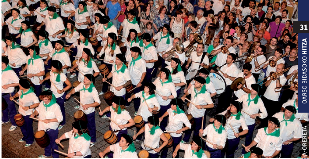
Herriko Plazan bukatzen du bidea Alabergakoa danborradak. ARDITURRI AUZO ELKARTEA

Momentu honetan, Alabergako danborradak «eskaera handia» duela zehaztu dute, eta bi urteko itxarote zerrenda dute bertan parte hartzeko. Batzordeak onartu du «ilusio handia» egiten diela parte hartzea, askorentzat «lotura emozionala» ere baduelako. Ilusioaz gain, «ardura» puntu bat ere badutela aitortu dute: «Uztailaren 21a da, eta ardura dugu Herriko Plazan ondo jotzekoa eta jendea gustura egotekoa». X