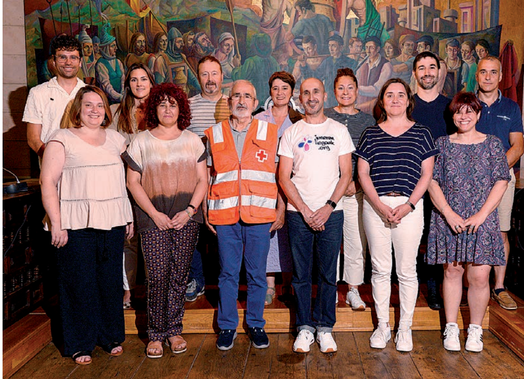
Udalbatzak bi elkartei harrera egin zien ekainaren bukaeran.

Gurutze Gorria mugimendu humanitarioa da, eta herrian 50 urte daramatza lanean. Zaurgarrien diren eta beharra dutenen artean eragiten dute, betiere lan boluntarioan. Mende erdiko etenik gabeko zeregin horretan, besteak beste, sorospen lanetan, pertsonak gizartera-