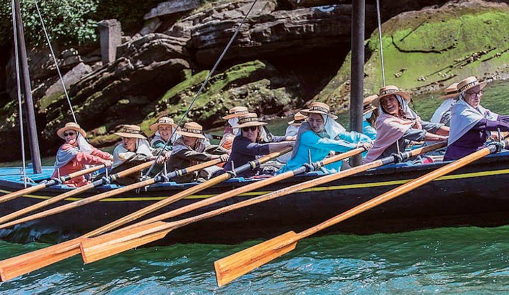
lazko edizioko irudi honetan, Batelerak, 'Ameriketatik' ontzian. Mendi Urruzuno