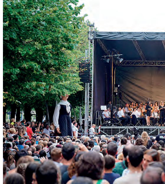
2022an Fermin Muguruza aritu zen txistulari kontzertuan.