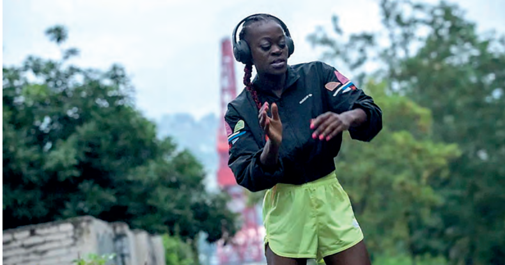
Afrika Bibangek kontzertua emango du abuztuaren 6an.

Ondoren, laguntzarik behar duen galdetu behar zaio. Erasotua izan bada, mediku arreta behar duen galdetu behar zaio, edo gertaera salatu nahi duen. Emakumearen denborak edo erabakiak errespetatu behar dira