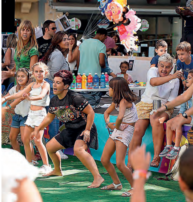
Atlantikaldiaren aurreko ekitaldi batean haurrei eta familiei begira antolatutako tailer bat. Olaia Gerendiain

Atlantikaldia musika da batez ere, eta bertako zein bisitarietako asko-asko kontzertuen aitzakian gerturatuko dira, musika eskaintza ezohiko bikaina aurkitzeko aukera paregabea eskaintzen duelako kultur topagune eta musika jaialdiak. Eta musika da batez ere, kartel buruek zein beste artistek izaten duten erakarmenarengatik, baina ez hori soilik. Izan ere, jaialdiak ordezkatzen duen aniztasun horretan, bertan aurki daitezkeen diziplina eta egitarau eskaintza opa-roa ere oso anitza delako. 11.