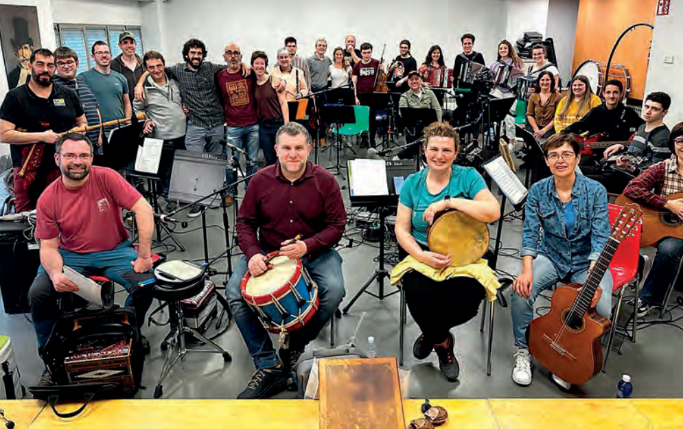
Asturiar konexioa prestatzeko saioetako bat. Herri Arte Eskola