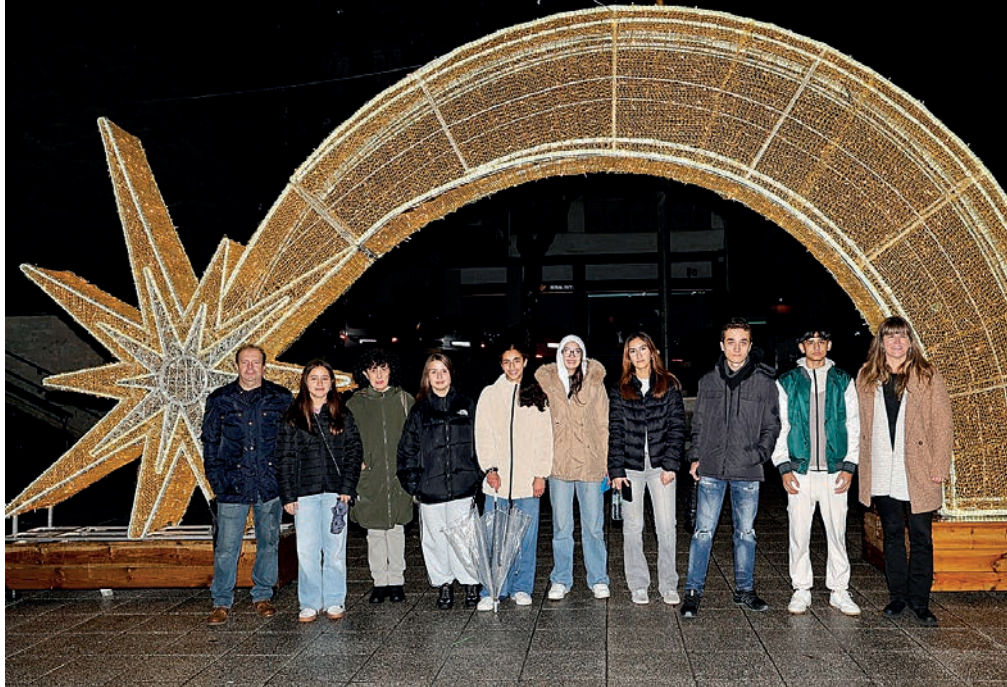
Ostiralean piztu zituen Errenkoaldek Gabonetako argiak Beraunen. HITZA

Joan den astean egin zuten gazte eta nerabeei begira antolatutako bigarren bideo lehiaketaren sari banaketa. Herriko saltoki bat aukeratu eta horren gainean bideoa egin behar zuten. «Iniziatibaren bidez saltokiak ezagutzen dituzte, inguruan dutenarekin harremanetan jartzen dira. Garrantzitsua da ezagutza, gero bertan erosiko badute». Beste alderdi batzuekin ere badu kezka Errenkoalde elkarteak, eta horien barruan jarri du digitalizazioa. Calvok